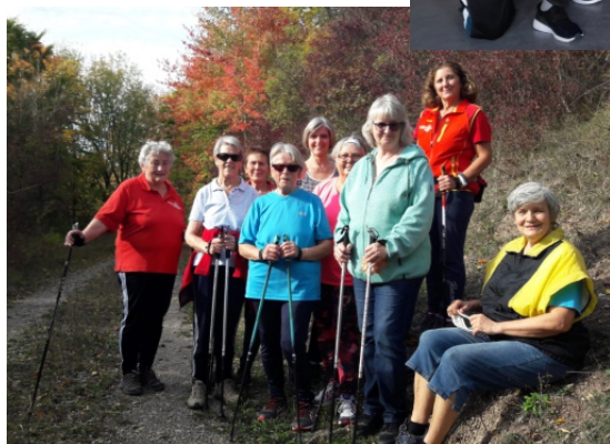
Walking Gruppe des TVW